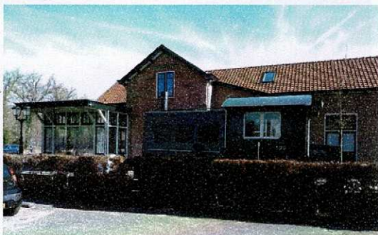
station Huis ter Heide

De spoorlijn zorgde er samen met de bosrijke omgeving voor dat zich langs het traject diverse villadorpen ontwikkelden. De spoorwegmaatschappij was bijvoorbeeld de belangrijkste aandeelhouder van de NV Villapark Bosch en Duin. 's Zondags waren de stations langs de lijn perfecte startplaatsen voor een boswandeling. Waar de spoorlijn de N237 kruiste was de Halte Huis ter Heide (Zie overzicht van de weg) Deze Halte was tevens dienst-woning voor de stationschef en sigaren-winkeltje. De lijn werd in 1941, net als veel andere Nederlandse spoorlijnen, opgebroken door de bezetter. Na de Tweede Wereldoorlog werd de lijn weer in gebruik genomen alleen voor goederenvervoer. In 1972 werd de lijn definitief gesloten.