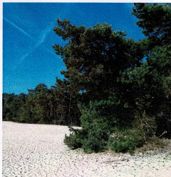
De Lange Duinen

Met de rug naar de molen staande, de MOLENWEG naar links inrijden. Na 30 meter scherp naar links KOLONIEWEG en na nog eens 100m rechtsaf RINKE TOLMAN PAD. Kruis de PARKLAAN schuin en steek bij de verkeerslichten de NIEUWEWEG over naar het fietspad aan de overzijde; hier naar links. Ga vlak voor de spoorwegovergang naar rechts, het talud af BOSSTRAAT. Rij de BOSSTRAAT helemaal uit tot de WIEKSLATERWEG OOSTZIJDE. Hier linksaf. Steek de DOLDERSEWEG en de spoorlijn over vervolg uw tocht over het fietspad langs de zandverstuiving de Lange Duinen tot de BEAUFORTLAAN Hier rechtsaf en na 50 meter linksaf over het spoor PALZERWEG